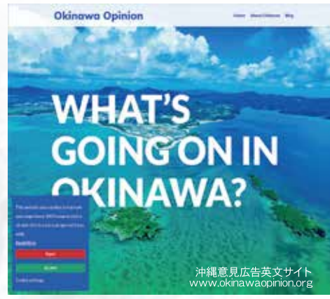
沖縄意見広告英文サイト www.okinawaopinion.org