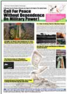
2012年ワシントンポストウエブ版