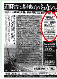
2014年毎日新聞・東京新聞・琉球新報・沖縄タイムス