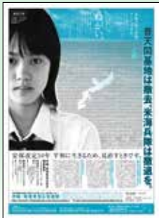
2010年朝日新聞・琉球新報・沖縄タイムス