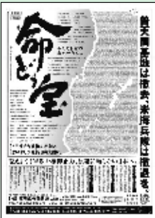
2011年朝日新聞・琉球新報・沖縄タイムス