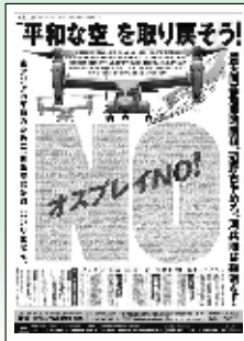
2013年毎日新聞・東京新聞・琉球新報・沖縄タイムス