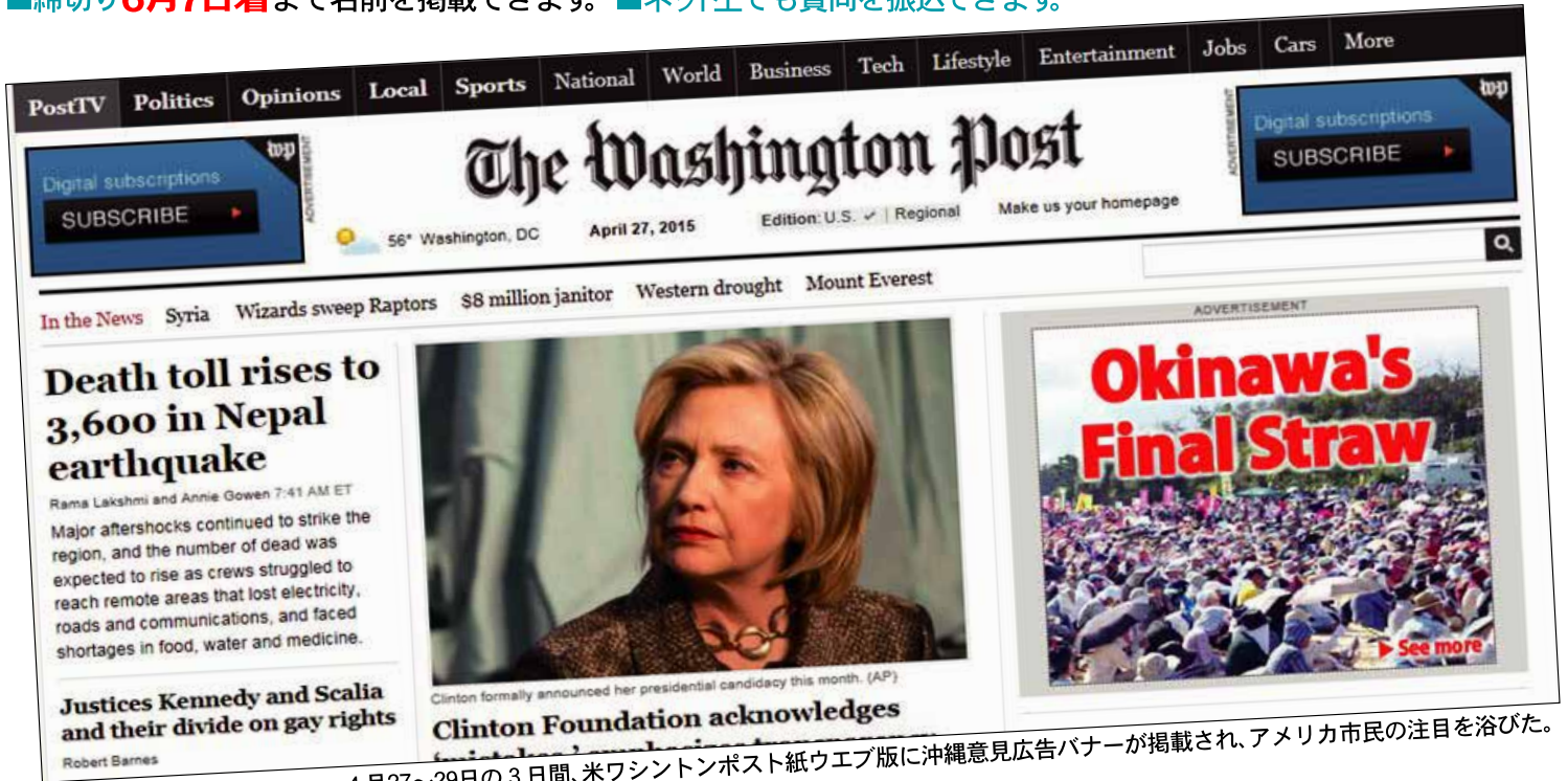
4月27～29日の3日間、米ワシントンポスト紙ウェブ版に沖縄意見広告バナーが掲載され、アメリカ市民の注目を浴びた。

■ 締切り 6月7日着 まで名前を掲載できます。 ■ ネット上でも賛同を振込できます。